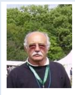
O Presidente da Direção da APP